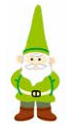
νάνος του κήπου